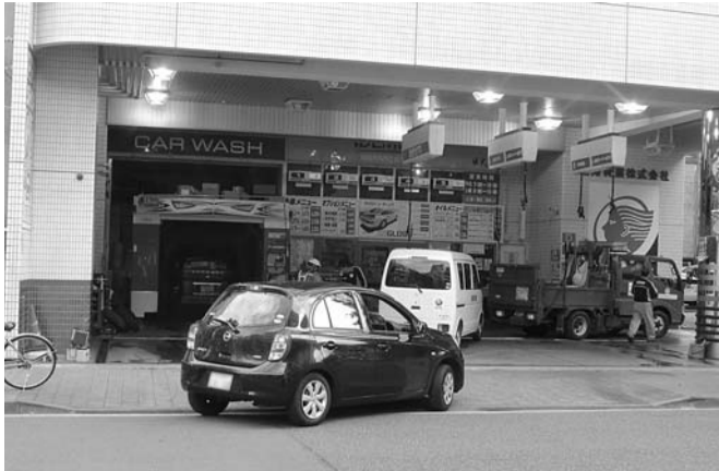
法人客が多い人気店