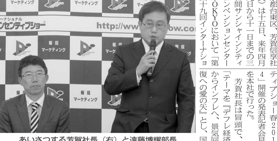
あいさつする芳賀社長(右)と遠藤博輝部長

【東京都】芳賀社長が挨拶を行った。挨拶は、本社で行われた。挨拶は、本社で行われた。挨拶は、本社で行われた。