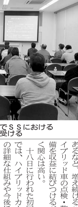
関心の高い上級HV講習会でSSSにおけるHVへの対応など講義を受ける

【神奈川県】東和興業・協定員上回る参加。HVセミナー上級編(森洋理事、十八日)編の二日を閉じた。平成二十五年度ハイ。次世代ハイブリッド製品販売業。に、平成二十五年度ハイ。次世代ハイブリッド製品販売業。に、平成二十五年度ハイ。次世代ハイブリッド製品販売業。