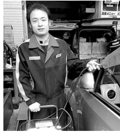
脱臭効果だけでなく除菌効果も「空爽力」にあることをアピールしている。法人客が多い人気店

油外商品の増益が喫緊の問題となっている現状に風穴を開ける製品が登場し注目を集めている。日比谷通りと第一京浜に挟まれた法人客中心の北海興業・東京都区部新橋六・四九、出光興産系(新橋給油所(所在地(本誌))・タクシー(本社・長野県岡谷市、電話〇二六六二二一四三〇〇)、濱横夫社長)の自動車専用オゾン脱臭機「空爽力」を、油外商品の主力となっている。 北海興業では軽自動車二台の設置にしているが、大型も一律の八百四十〜八百六十ワットで利用率は高いという。SSSの新入される。は高いという。オゾン脱臭機「空爽力」は、油外商品として期待されている。