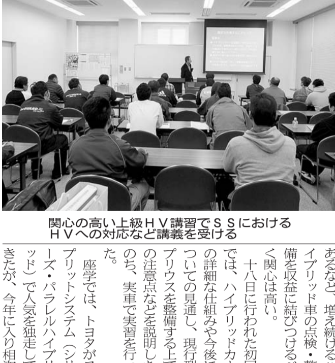
関心の高い上級HV講習会でSSSにおけるHVへの対応など講義を受ける